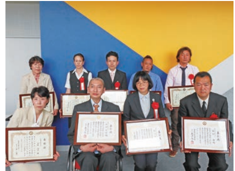
表彰された皆さま方