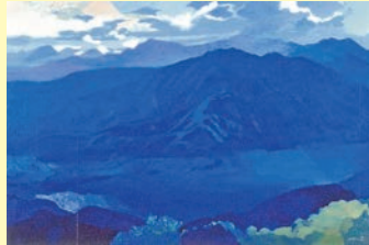
奥大井幽谷 II 120 F